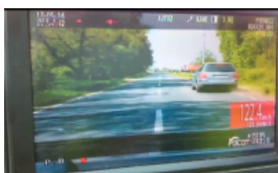
Kierowca passata zatrzymany w pościgu

Dodatkowo w pojeździe obecna była 56-letnia pasażerka, która udostępniła pojazd mężczyźnie – za co została ukarana mandatem karnym. Teraz mężczyzna za swoje czyny odpowie przed sądem.