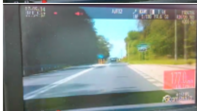
Kierowca passata zatrzymany w pościgu