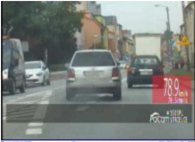
Policyjny pościg za nietrzeźwym kierowcą