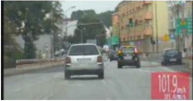
Policyjny pościg za nietrzeźwym kierowcą