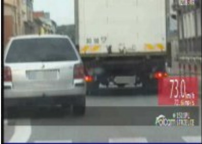
Policyjny pościg za nietrzeźwym kierowcą