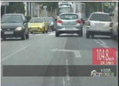
Policyjny pościg za nietrzeźwym kierowcą