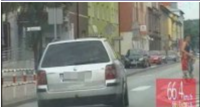
Policyjny pościg za nietrzeźwym kierowcą