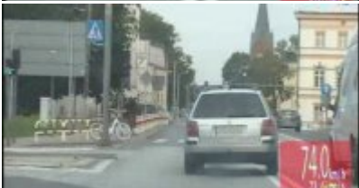
Policyjny pościg za nietrzeźwym kierowcą