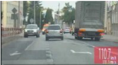
Policyjny pościg za nietrzeźwym kierowcą