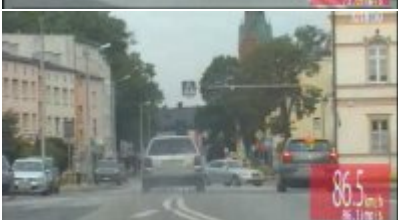
Policyjny pościg za nietrzeźwym kierowcą