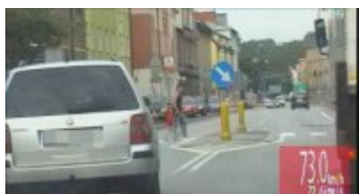
Policyjny pościg za nietrzeźwym kierowcą

· Kierowca, który świadomie zmusi policję do pościgu i - chcąc uciec - nie zatrzyma się pomimo sygnałów świetlnych i dźwiękowych, popełni przestępstwo zagrożone karą do 5 lat więzienia. Sąd obligatoryjnie zakaze mu prowadzenia pojazdów na okres od roku do 15 lat.