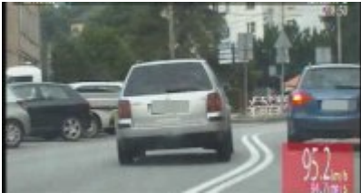
Policyjny pościg za nietrzeźwym kierowcą