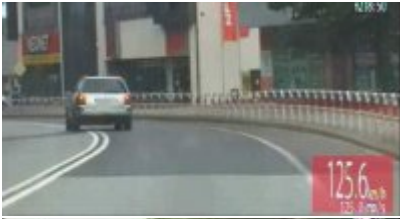
Policyjny pościg za nietrzeźwym kierowcą