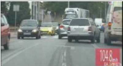
Policyjny pościg za nietrzeźwym kierowcą