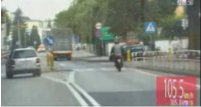
Policyjny pościg za nietrzeźwym kierowcą