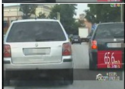
Policyjny pościg za nietrzeźwym kierowcą